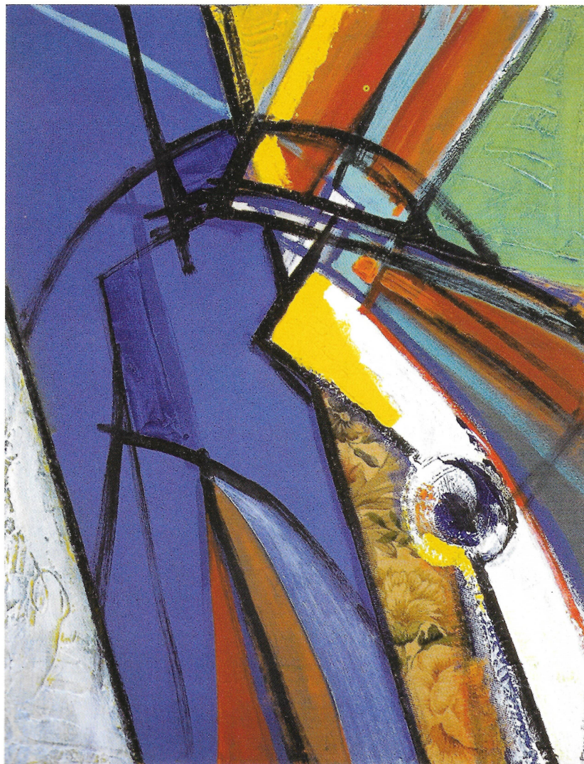
ENTRAMADO VI - 1999 Técnica Mixta - Tabla 46 x 59 cms.