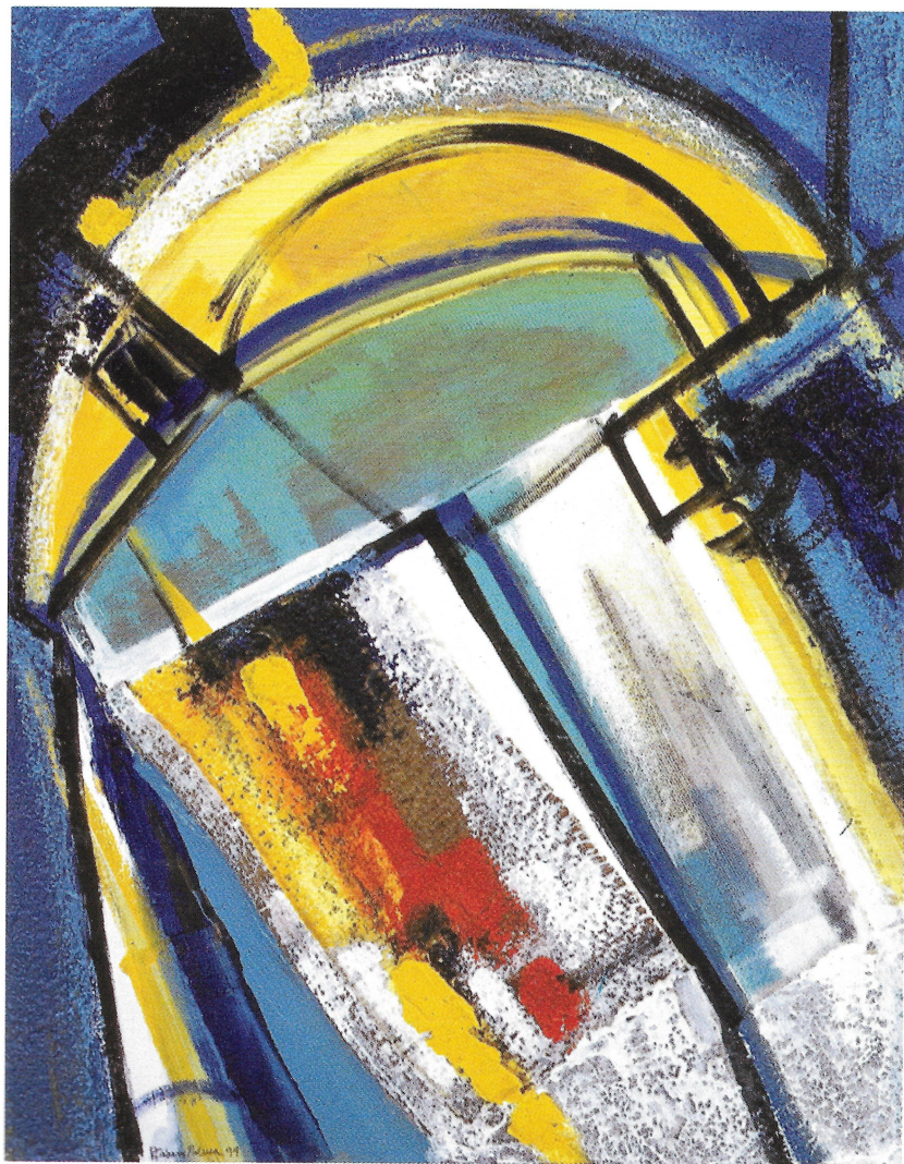
ENTRAMADO III - 1999