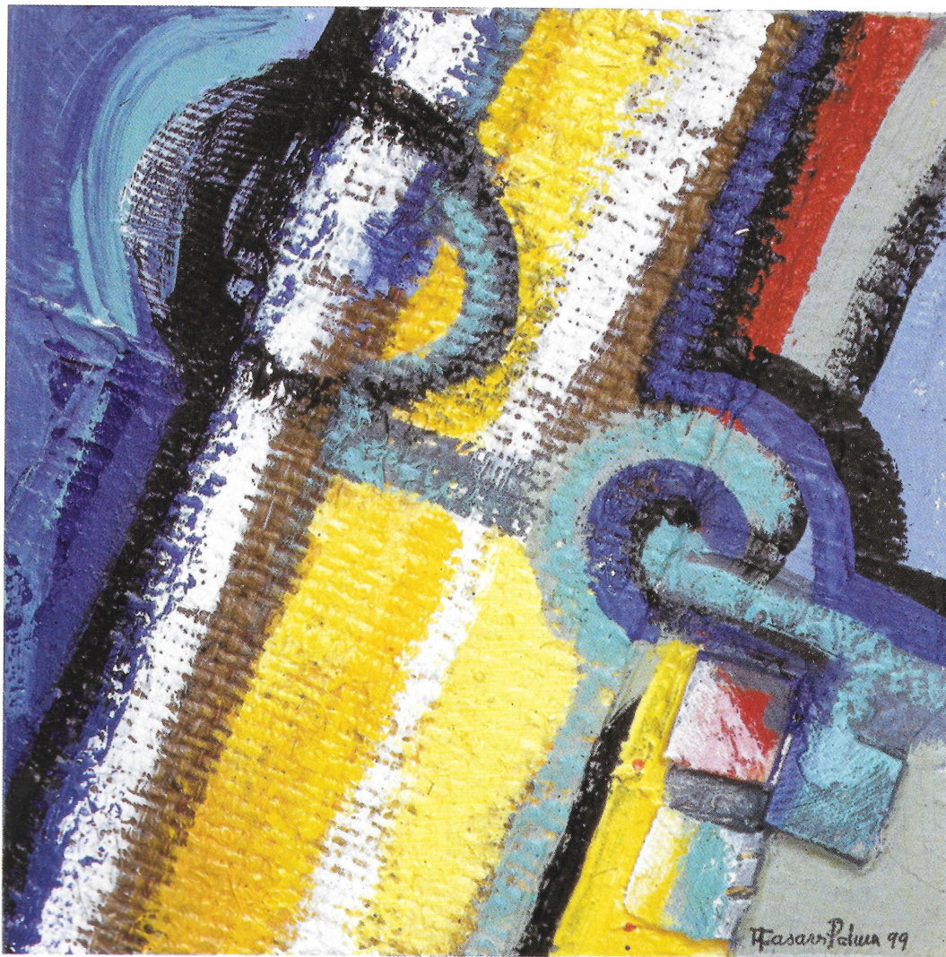
SERIE IBIZA - BOCETO III - 1999